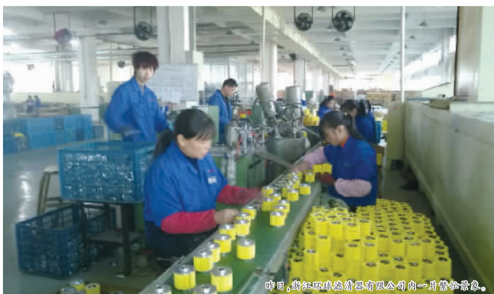
昨日,浙江环球滤清器有限公司内一片繁忙景象。

记者昨日从有关部门了解到,在金融危机背景下,全球汽车滤清器生产陷入萎缩,而瑞安滤清器销量今年却逆势增长 14.5%。市质监局局长吴功宜说,我市滤清器行业能够实现逆势增长,得益于通过制定实施联盟标准,让整个产业的发展水平上了一个新台阶,产品打入国际高端汽车配件市场。