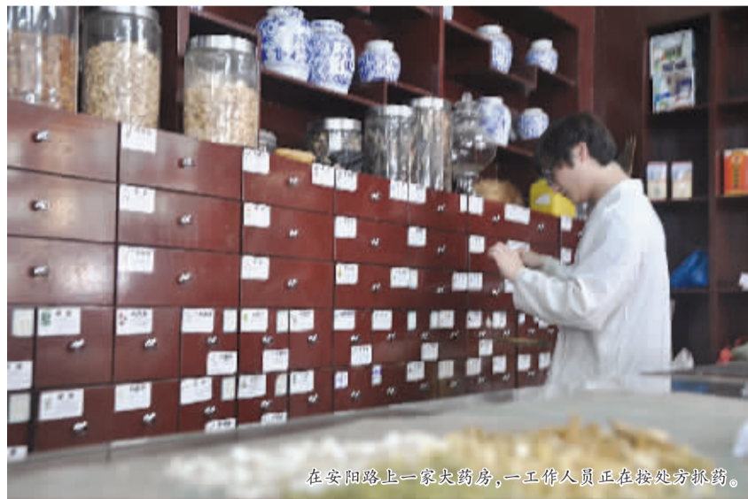
在安阳路上一家大药房,一工作人员正在按处方抓药。

本报讯(见习记者 陈思思)“同样一帖药,今年比去年贵了不少。”近期,不少市民在购买中药时发现,比起去年,麦冬、党参等常用中药材价格上涨了不少。