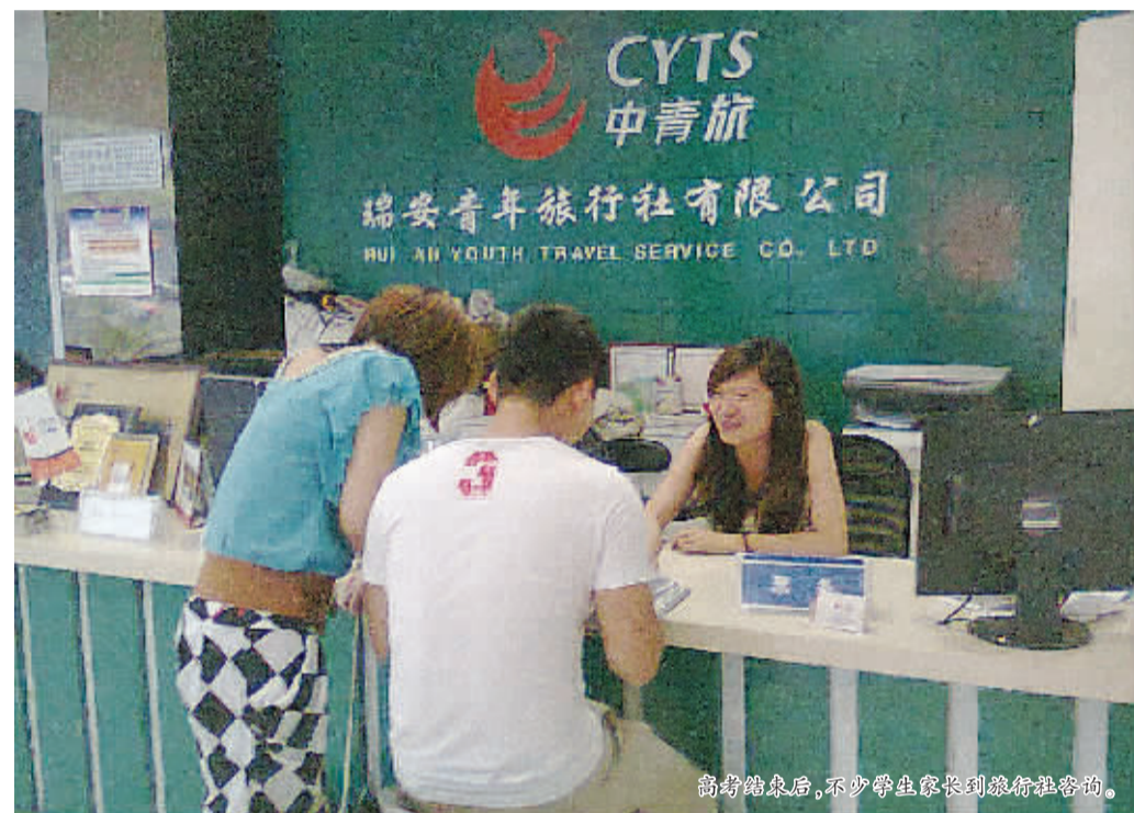
高考结束后,不少学生家长到旅行社咨询。

随着高考结束,旅行社又迎来学生出游旺季。记者近日走访市区多家旅行社了解到,高考结束后,旅行社接到的学生咨询和报名呈现递增趋势。与往年不同的是,“高中生市场更大了、更成熟了。”这让不少旅行社将目光投向“高中生”这一群体。