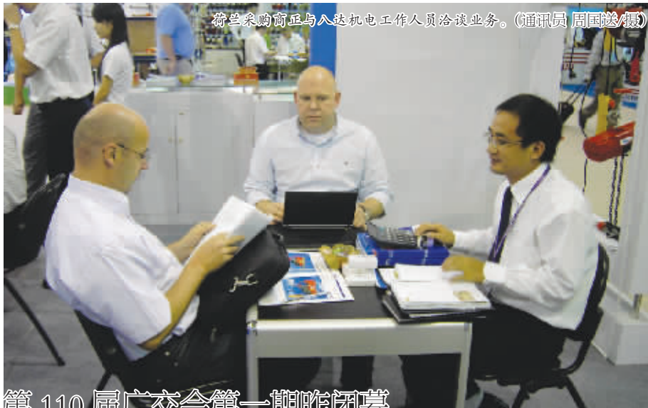
荷兰采购商正在与八达机电工作人员洽谈业务。

据统计,目前我市有开展出口业务的出口企业932户。今年1至9月,市国税局已累计办理出口退(免)税164514万元,同比增长25%,其中办理出口退税139914万元,同比增长32%,有效缓解企业资金占用压力。