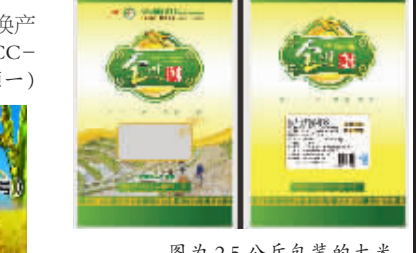
图为2.5公斤包装的大米

高山梯田)。2009年,在市委、市政府及有关部门的支持下,按照GB/T19630.1-4《有机产品》和浙江省地方标准DB33/T366-2002《有机稻米》规定技术标准,结合本土土壤、气候等自然条件,在杜山、山林两村(面积420亩)试种有机稻米并取得成功,同年12月产出的“川和”牌高山梯田有机大米获得中绿华夏有机