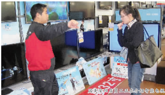
国美安阳店员工正在介绍智能电视

国美电器安阳店的工作人员介绍,店里已有多款智能电视机。像创维推出的 E83RS 云电视,采用不闪式 3D 技术,推出至今已售出 10 多台;海信推出的 XT770 采用独有精准语音识别技术,电视机可识别用户发出的特定指令,可以进行腾讯