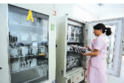
输血前护士校对资料