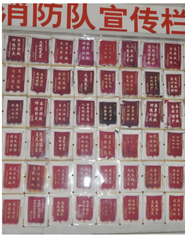
消防队宣传栏挂满锦旗

自成立以来,该消防队共参与火灾扑救1000多次,为群众挽回经济损失近亿元,收到群众赠送的感谢锦旗140多面。