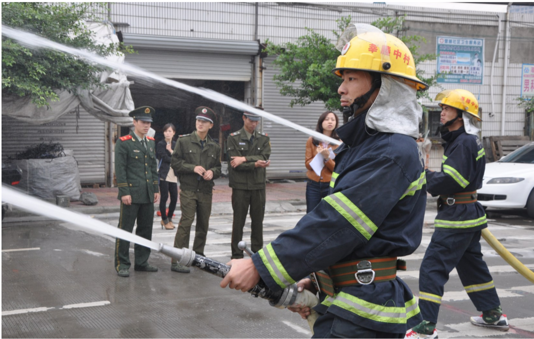
在消防演练中提高能力

一辆人力板车、两台手抬消防泵,这是他们最早的灭火装备;如今,他们拥有了专业的消防车,成为周边地区老百姓心中的“守护神”,每当有火灾,他们总是冲在火场第一线。 这就是瑞安最早的“民间消防队”——莘塍中村志愿消防队,也被趣称为“老板消防队”。成立至今,这支队伍已经走过了24个年头。 在莘塍中村志愿消防队的墙壁上,一张张消防车的照片,诉说着自1989年以来的成长过程;140多面锦旗和数不胜数的荣誉证书,则彰显了他们的辉煌“战绩”。