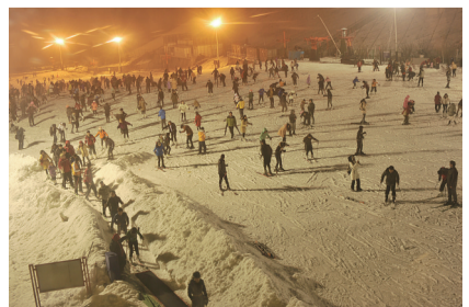
22时了，4个人挤在一个房间里，看着春晚，发短信跟亲朋好友拜年，就这样迎来了蛇年的第一个小时。