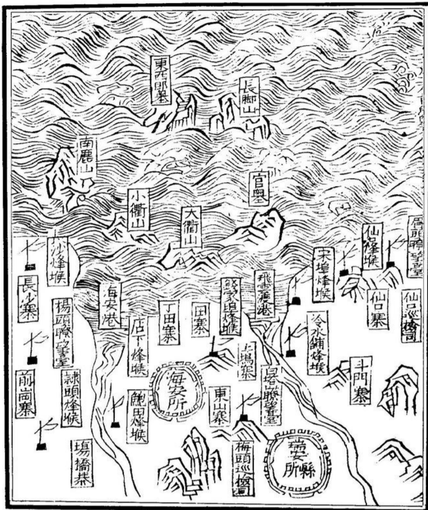
《筹海图编》中记录的瑞安地图