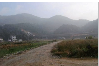
飞云江 白塔尖 在潘岱白象村

在瑞安,有一句十分有名的民间谚语,谚语为“潮大漫不过白塔尖,水急冲不掉净水崖”。这句谚语是什么意思,有什么故事传说?