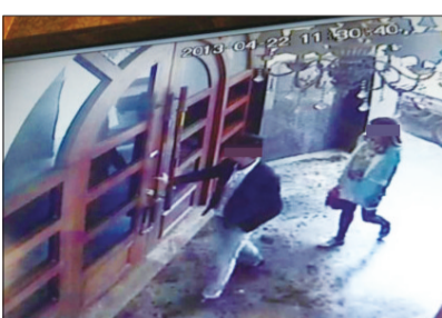
一男一女拉开售楼大厅大门