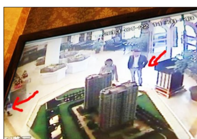
男子缠住工作人员,女子走出视线