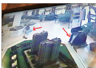
男子观看模型,女子走向柜台