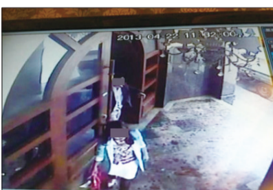
两人走出售楼大厅