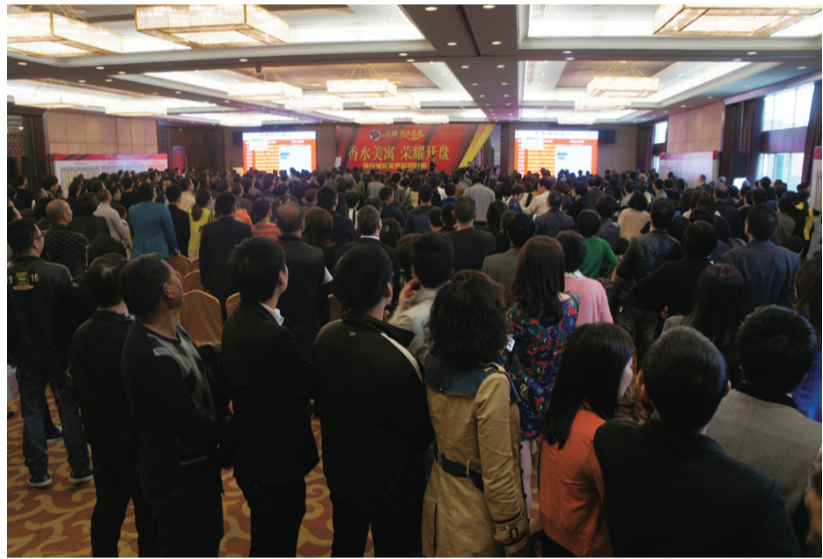
香水美寓开盘现场火爆