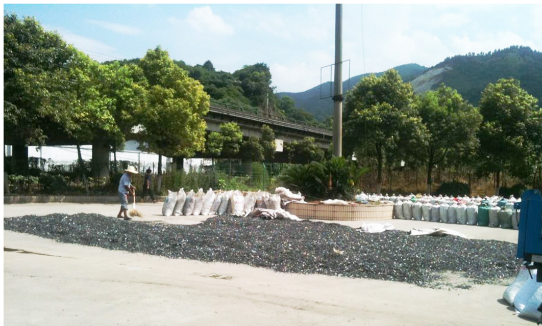
塑料清洗加工点的工人在路边晒塑料颗粒

近年来,塘下镇依法整治三都片废旧塑料清洗业,三都片9个村的废旧塑料清洗户一律被断电停产,非法加工设备被全部捣毁。几年过去了,整治效果如何?记者作了调查。