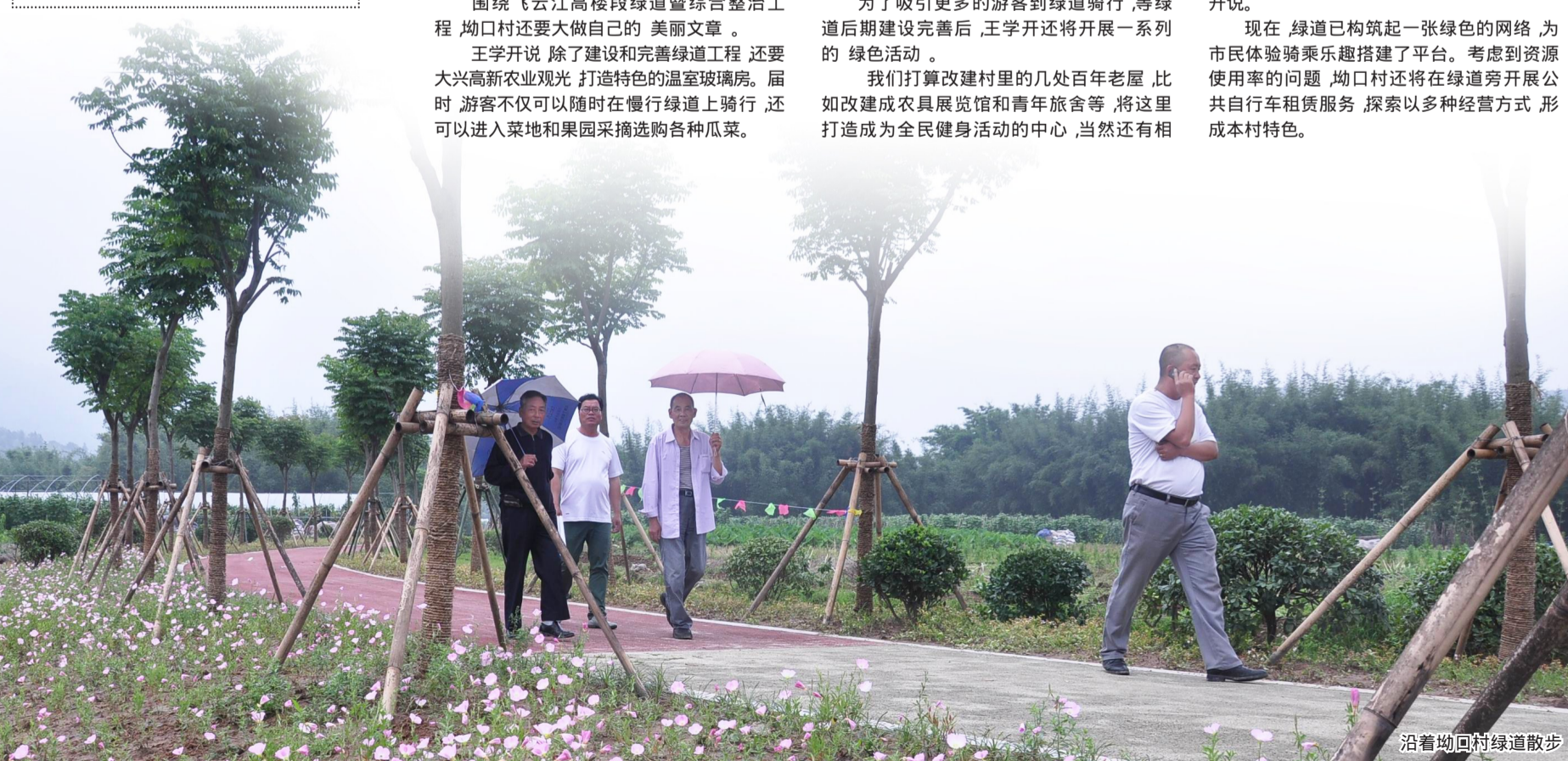
沿着垟口村绿道散步

应的配套设施。王学开说。 同时,垟口村还准备举行书画、摄影等展览,以丰富绿道内涵。未来,在乡村山林路段举行学生越野活动,到乡村田野举行农家乐活动等,努力打造一条郊游型的绿道。王学开说。 现在,绿道已构筑起一张绿色的网络,为市民体验骑乘乐趣搭建了平台。考虑到资源使用率的问题,垟口村还将在绿道旁开展公共自行车租赁服务,探索以多种经营方式,形成本村特色。