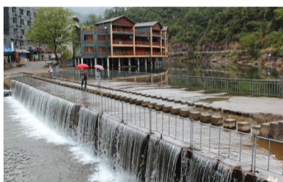
陡步·流水·人家