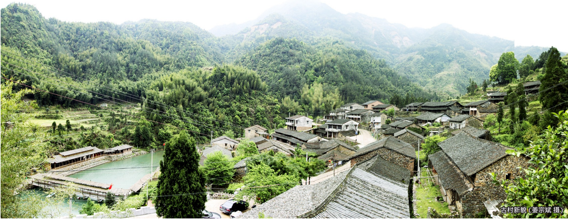
古村新貌