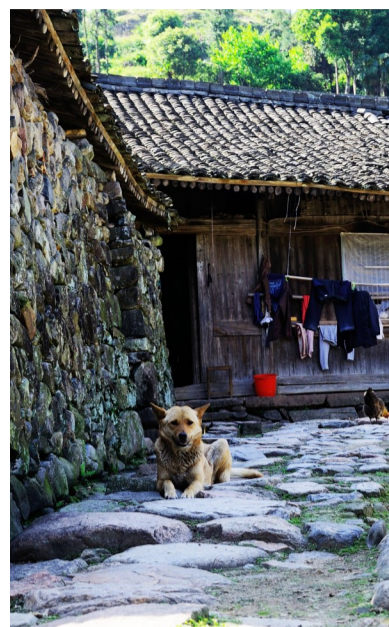
守护老屋