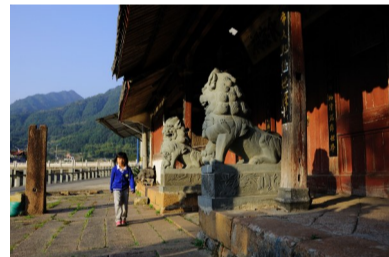
卢氏祠堂

下期主题： 美丽乡村·新农村建设 双胞胎趣图 来稿方式：请登录云江论坛 酷图贴吧 ( http://bbs.rarb.cn )贴图,欢迎加入瑞安日报 《广角镜》专用QQ(2582063826)。