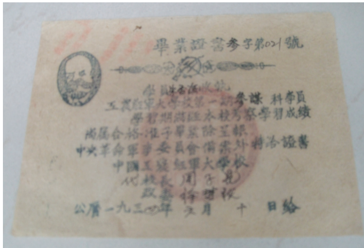
工农红军大学毕业证书

瑞安市社科联 协办 电话: 65818090 电子邮箱: 94122480@qq.com