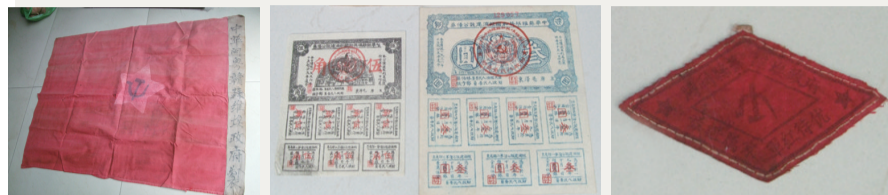
中华闽粤赣苏维埃政府党旗