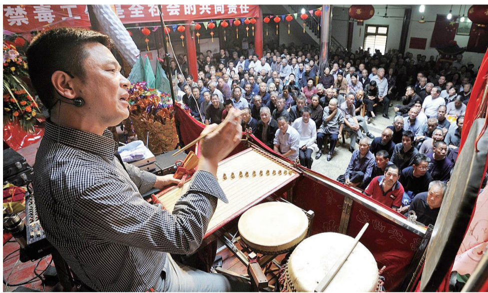
市区城北村活动中心，一位琴师正在演唱 娘娘词 近千名村民赶来聆听

周巨展介绍，来自闽地的移民，部分来自福建赤岸，赤岸，古代属福州长溪县，清时属霞浦县，霞浦县与古田相近，现同属于福建省宁德，故赤岸人完全有可能在当时已经信仰娘娘，他们迁移到瑞安后，也把陈十四信俗带到瑞安，并立庙祭祀。