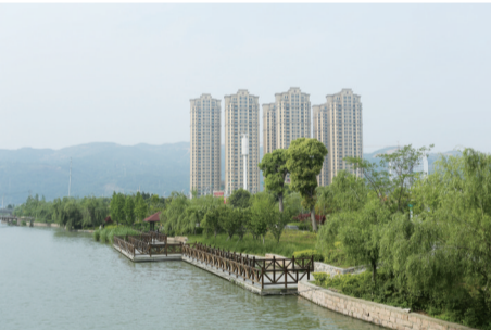
罗阳大道沿河景观带

每逢周末，罗阳大道沿河景观带总有不少锻炼的市民，成为瑞祥新区一道亮丽的风景线。这条一直延伸到瑞枫公路的景观带总长约1.7公里，却只是瑞祥新区10余公里沿河绿化带的一小部分。 据了解，瑞祥新区从建设初期就一