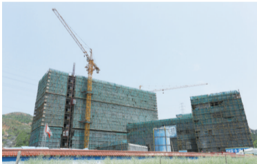
人民医院瑞祥分院

在市人民医院，常看到如下场景：万松路上排起长长的车队，许多车辆在排队等待进入医院；医院里，市民扎堆排