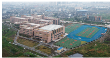
瑞祥实验学校

如今，为了孩子上学而置业的家长不在少数，特别是每年幼儿园升小学、小升初、初升高之际，现代版“孟母三迁”更是频频上演。然而，选择瑞祥新区，家长们的这些烦恼将一扫而光。 瑞祥新区设有两所设施齐全环境优美的高档幼儿园——瑞祥第一幼儿园和华龙贵族幼儿园。目前，瑞祥第一幼儿园已经投入使用，该园内室内恒温游