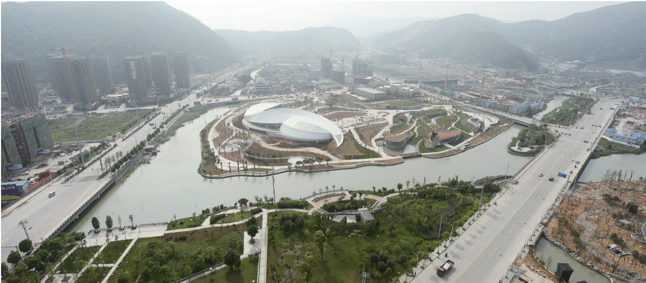
瑞祥新区路网建设

所谓“筑巢引凤”，好的投资成长环境，才能引来好企业、留住好项目；好的生活居住环境，才能聚集超高人气、留住有识之士。 为了筑好巢，新区从市政规划之初就高起点、大手笔，基础设施和公建配套同步抓，打造瑞安城市人居生活的典范。它的建成，将整体提升瑞安的城市品位，更将给市民带来全新的生活理念。随着瑞祥新区建设步伐的加快，一道新的城市风景即将崛起在万松山畔。