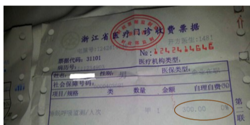
另一患者的收费票据