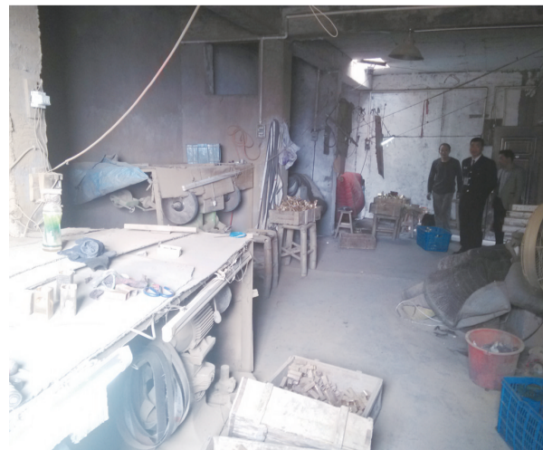
工作人员检查抛光企业

抛光车间每天都要清理，使作业场所积累的粉尘量降至最低；安装相对独立的通风除尘设备和收尘设施（严禁直排），收尘设施要设置在建筑物外露天场所，回收的粉尘应储存在独立的堆放场所；需配备消防器材和个人劳动防护用品，必须使用消防沙灭火，灭火时应防止粉尘扬起形成粉尘云，严禁使用普通灭火器灭火。