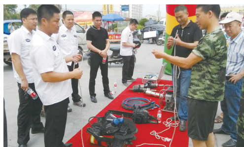
活动现场，工作人员演示消防器材

电镀加工是金属洗涤的过程，工作场地比较潮湿，容易导电，员工需穿水鞋，做好防漏工作；在电镀加工过程中用到大量的危化品，必须设置独立的危化品仓库，并且实行双人管理，需指纹输入才能进出；危化品进出厂需要登记，做好台账记录；另外，在作业过程中，工人要做好个人安全防范措施。