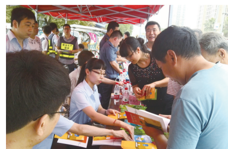
活动现场，市民积极了解安全生产知识