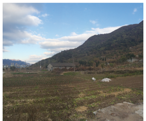
林氏祖先曾居住在塘吞底