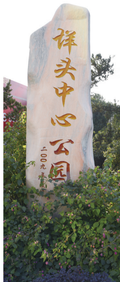
垟头中心公园