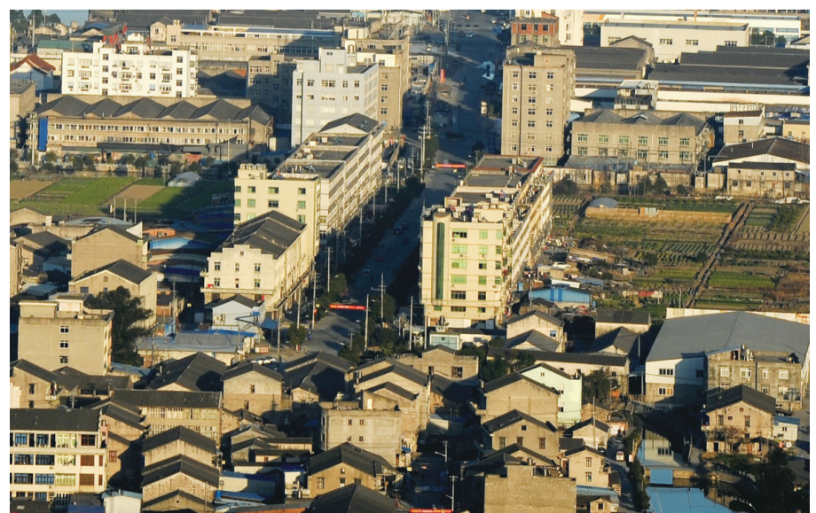
垟头村新貌