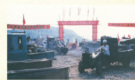
1992年安阳新区奠基典礼

规划者当时担心的“缺少人气”,已经不复存在。毕竟,一个城市的发展,需要一个过程。