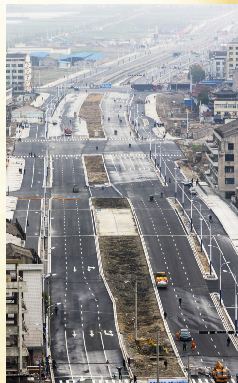
万松东路延伸段通车