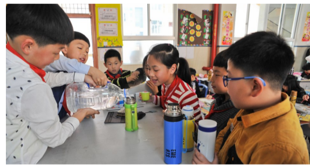
在瑞祥实验学校,孩子们分享矿泉水

看来停水24小时,市民情绪并没有因此受太大波动。不过通过停水,也让大家明白了节约用水的重要性,再次懂得了要珍惜水资源。