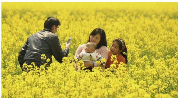
市民在油菜花地里留影