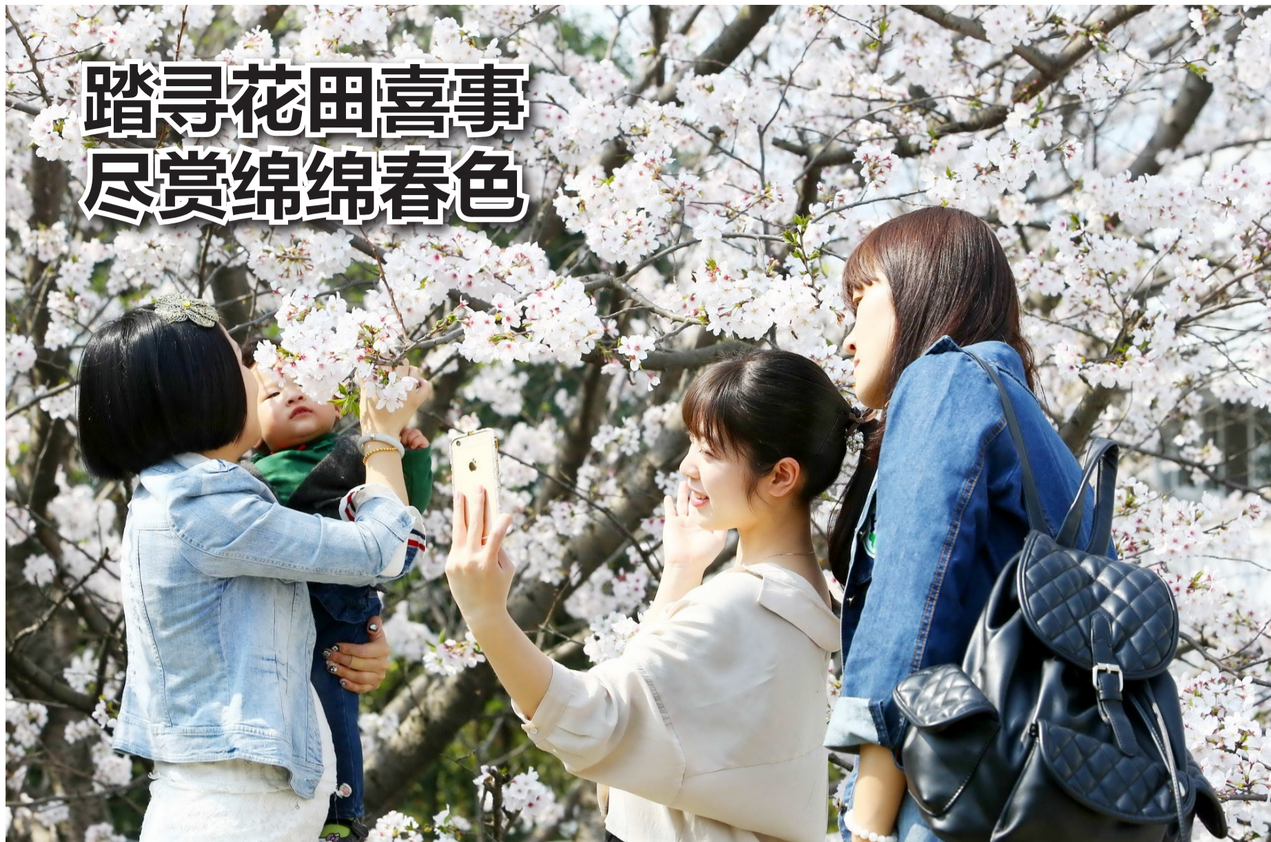
市民在西山樱花前拍照