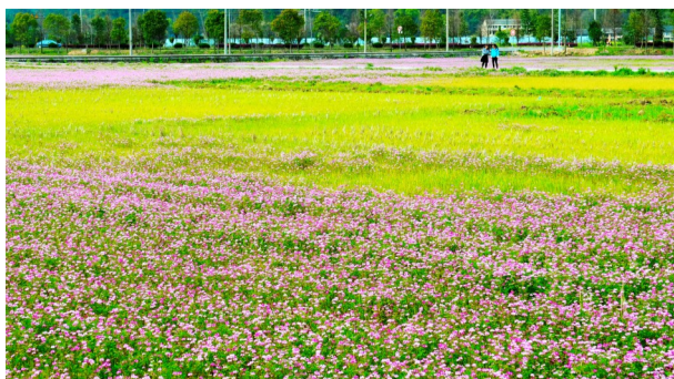
瑞枫线陶山段公路边紫云英和油菜花