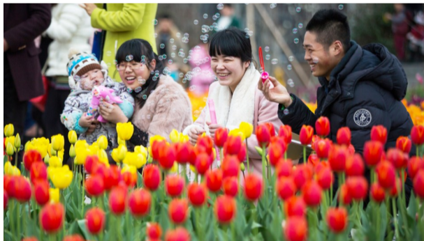
鲜艳的郁金香吸引市民前来观赏