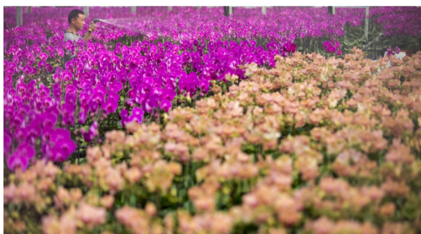
富寿园岁的大棚内开满蝴蝶兰