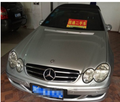
车型:奔驰 1.8L 高配 上牌时间:2003年5月13日 年审情况:2015年5月 行驶里程:7.3万公里 现售价:20.8万元