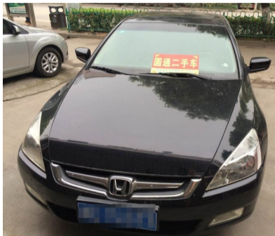
车型:雅阁 2.0L 高配 上牌时间:2013年9月22日 年审情况:2016年1月 行驶里程:8万公里 现售价:8.2万元