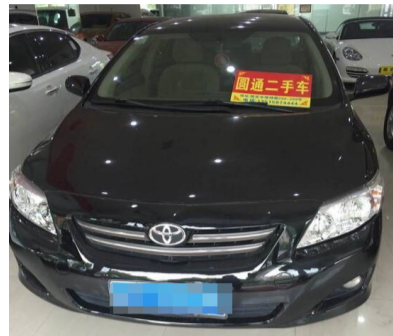
车型:卡罗拉 1.6L 上牌时间:2009年11月2日 年审情况:2015年11月 行驶里程:13万公里 现售价:6.5万元