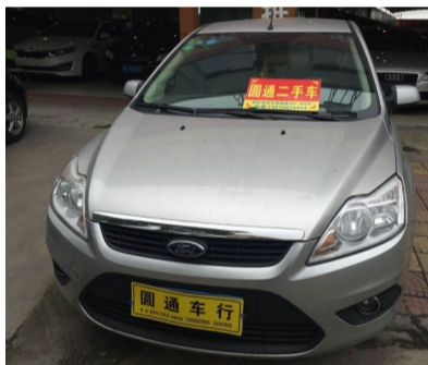
车型:福克斯 1.8L 高配 上牌时间:2013年5月17日 年审情况:2015年5月 行驶里程:1万公里 现售价:7.8万元