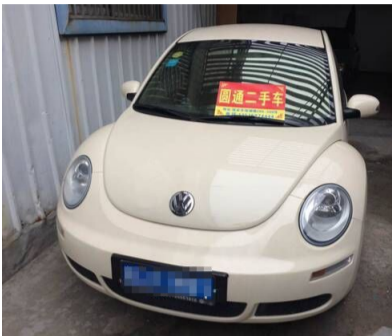
车型:甲壳虫 1.6L 高配 上牌时间:2010年11月 年审情况:2016年11月 行驶里程:4.3万公里 现售价:10.5万元