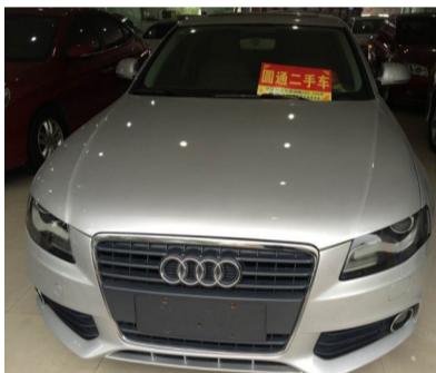
车型:奥迪 A4 2.0L 中配 上牌时间:2009年7月31日 年审情况:2015年7月 行驶里程:7.5万公里 现售价:16.5万元