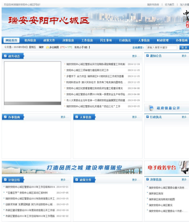
瑞安安阳中心城区网站首页大片 留白

依靠一次国家层面的普查活动。当地政府部门应该制定更加具体的规定，形成相应的约束及处罚机制，给自己的网站施压，督促信息的公开与及时更新。另外，政府部门应该加强网络智慧政务办公，让一切可以在网上办理的业务均设置相应平台，这样既能真正服务于民，又能促使网站信息的更新。