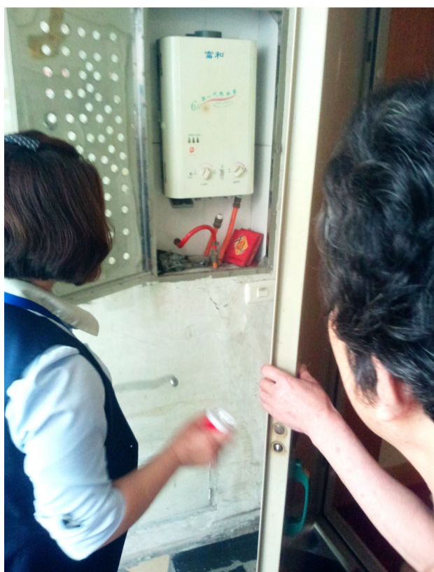
安阳管道燃气公司工作人员上门为清莲小区居民检查燃气安全

从昨天下午开始,燃气公司将陆续走进我市的一些小区进行用气安全宣传。除了解用气安全知识外,市民还可以在现场向燃气公司预约上门检查,或者拨打免费维修电话65810788。