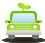
塘下公交车线路开通时间表