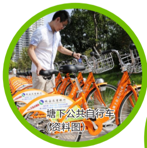
塘下公共自行车 (资料图)