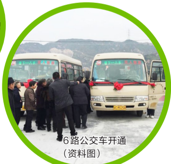
6路公交车开通 (资料图)