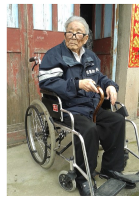
抗战文职老兵黄公望