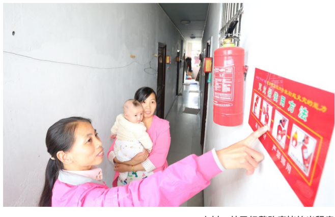
上村一处已经整改完毕的出租房