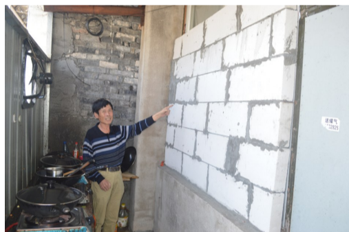
陈棉通用实体墙隔断厨房与出租屋