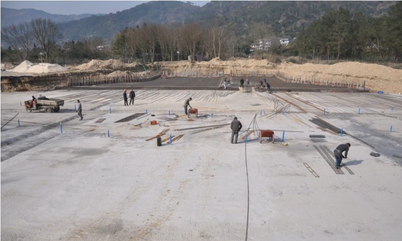
人造海浪池施工现场

去上海欢乐谷——太远;去香港玩迪士尼——太贵;去国外玩个痛快——又远又贵。如果告诉您,今年5月开始,您在“家门口”就能玩到来自西班牙的高空索道、丛林探险;国内顶尖的人造海啸水上乐园,您会不会惊讶? 这不是在说笑,就在我市高楼镇下泽村,寨寮溪风景区边上,一座面积近200亩,投资1.4亿元大型原生态国际化游乐园“幸福谷”正在建设中,欧洲进口的原装游乐设施,国家4A级景区的优美环境,家门口“国际范”的大型游乐园,几个月后,肯定能让您玩得痛快!