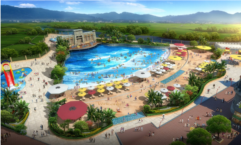
人造海浪池建成效果图