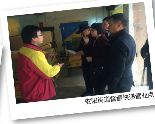
安阳街道督查快递营业点