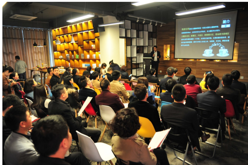
创e公社入驻活动现场