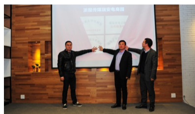
三位嘉宾把手同时放在投影幕布上揭牌

资源对接、创客路演……昨日下午，市电子商务公共服务中心资源对接会暨创e公社入驻仪式，在瑞安日报万事好网络经济创新产业园“悦创空间”举行。现场，创客们创新的思维，带来了一场头脑风暴。