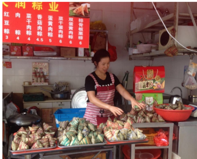
专明菜市场一摊位前

昨天,记者走访市区多家菜市场、超市和糕点店发现,各家的宣传攻势早早打起,显眼的位置摆上了各式各样的粽子。今年的粽子包装大多比较简单,礼盒的价格多在一两百元左右,简装版适合家庭购买食用的则仅售几十元。