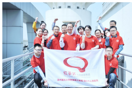
瑞医神经内科参加红手环志愿活动,希望有更多人关注卒中患者。