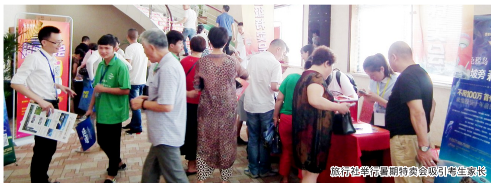
旅行社举行暑期特卖会吸引考生家长