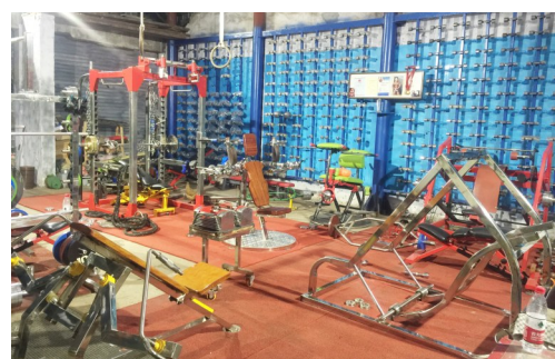
摆满健身器材的私人健身房