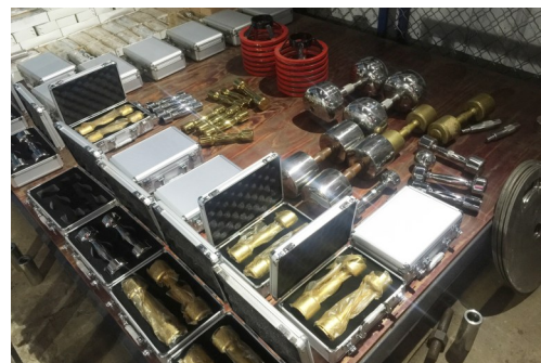
几十种不同设计的哑铃