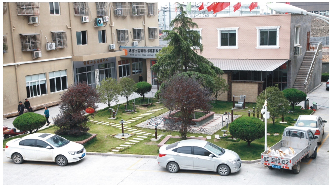
塘下镇浦桥村的社区居家养老服务照料中心

目前我市健康养老服务业的现状如何?发展路上的“绊脚石”是什么?十三五期间又有什么计划和举措呢?