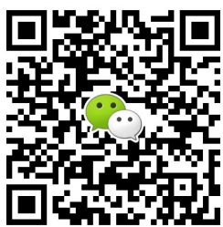
瑞报财管家微信群