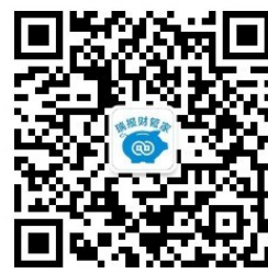
瑞报财管家 公众号