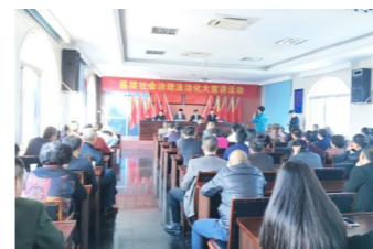
在海安办事处开展基层法治大宣讲活动

2016年,在全市开展宣讲121场,播放专题片1018场,共计发放专题片1000张,宣传资料10000余册,悬挂横幅900多条。市司法局负责人表示,大宣讲活动使广大村民的法律意