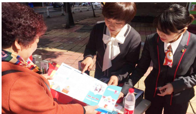
播放金融风险防范知识;在营业网点设置咨询台;等,向客户介绍金融消费者权益。

3月14日,该支行工作人员在安阳菜市场开展宣传活动,向过往群众现场讲解金融消费者权益相关知识。同时,该支行充分利用营业网点LED显示屏、自助设备等设施,滚动