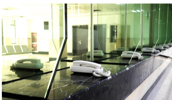
会见室内的电话供戒毒人员和亲友通话