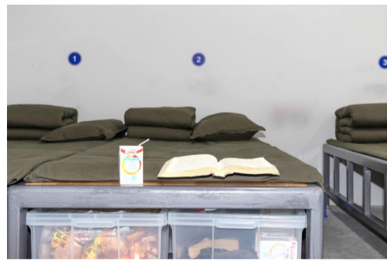
戒毒人员休息时看书喝牛奶