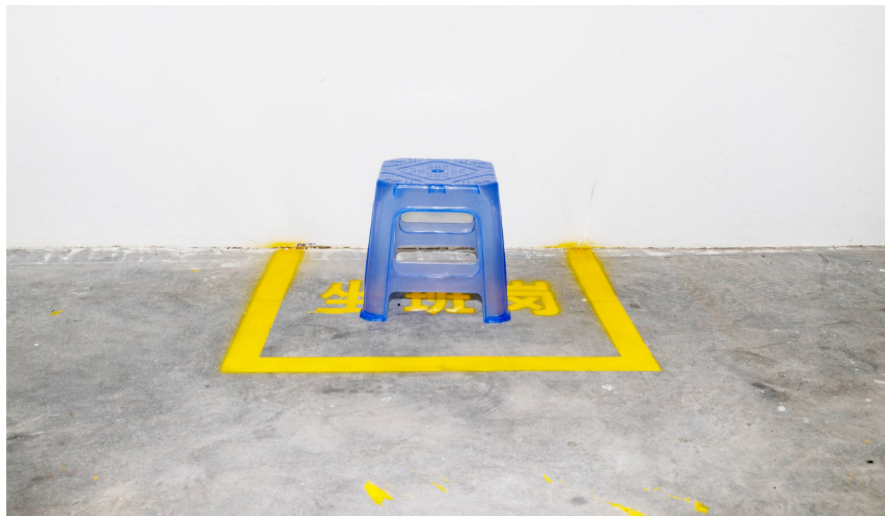
坐班岗,戒毒人员在病房内轮流坐班,相互监督。

一个人吸毒,伤害的不仅是他自己,还有整个家庭。因为吸毒,让很多家庭破碎,妻离子散。一开始偶尔吸一点,后来因为常跟家人争吵,毒瘾越来越大。每个月花在毒品上的钱将近4000元。一名戒毒人员告诉记者,染上毒瘾后,为了买毒品,常向父母、亲戚、朋友编造各种理由骗钱。结婚后,有一次当着老婆的面,与朋友一起吸毒,老婆忍无可忍,和我离婚了。他说,夜深人静时,经常独自默默流泪,心中满是对家人和孩子的愧疚。