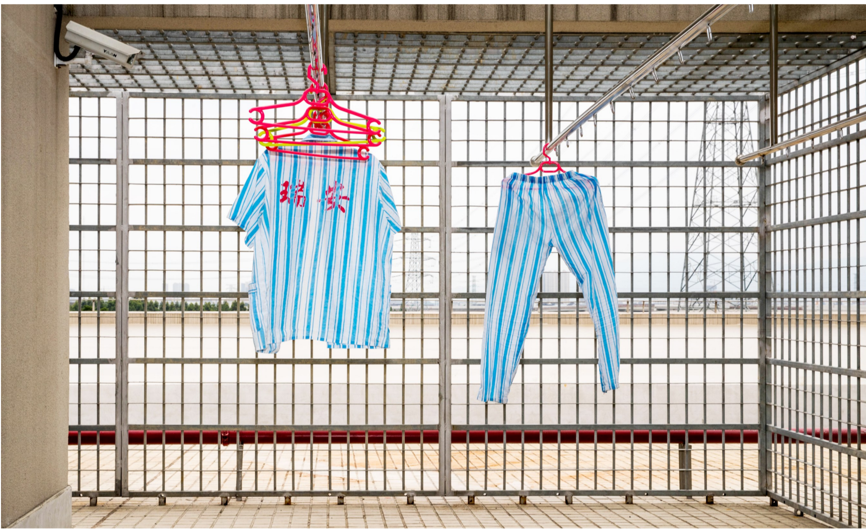
在楼顶的晾衣阳台上晾晒着戒毒人员统一服装