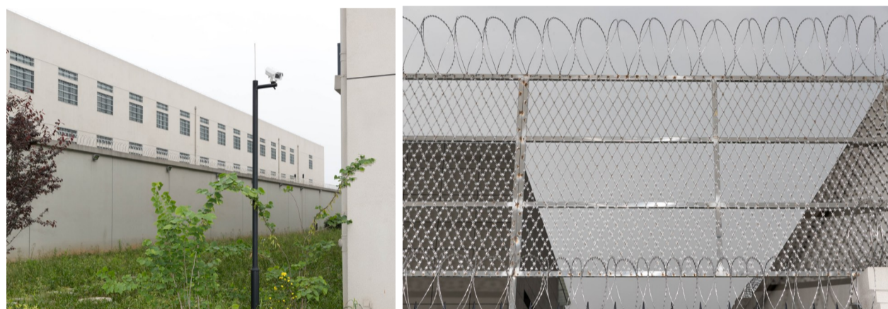
戒毒所内,一台监控屹立在草坪上。

毒品对人的危害非常大,强制隔离戒毒所的民警们一直在努力,想方设法帮助戒毒人员戒除毒瘾、重获新生。