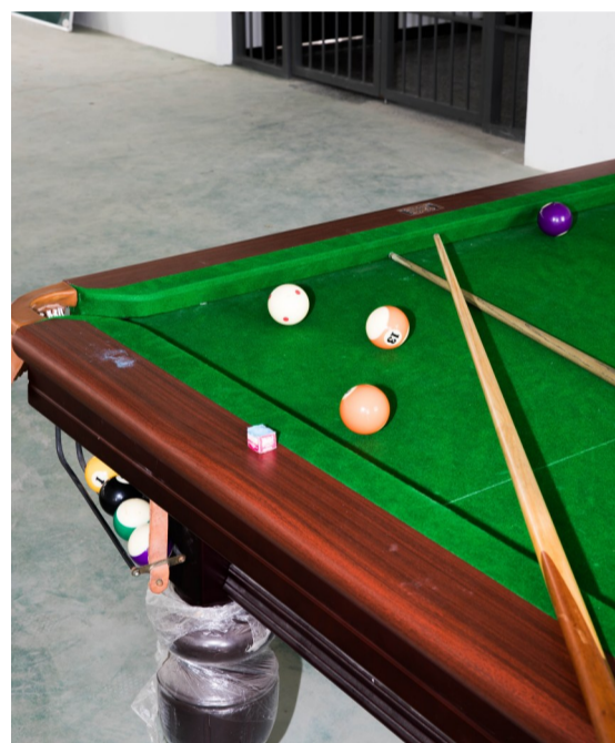
台球是戒毒人员比较喜欢的娱乐项目