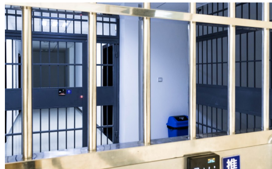
各个区域由一道道铁门隔开