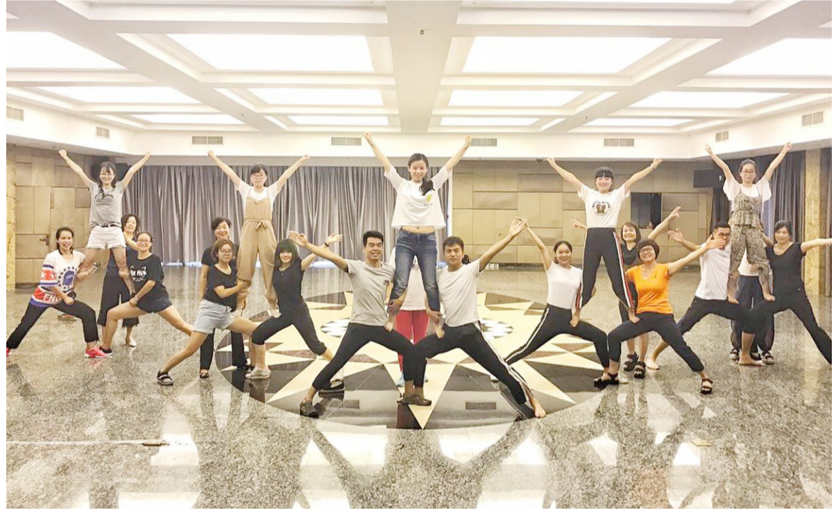
健美操(啦啦操)培训