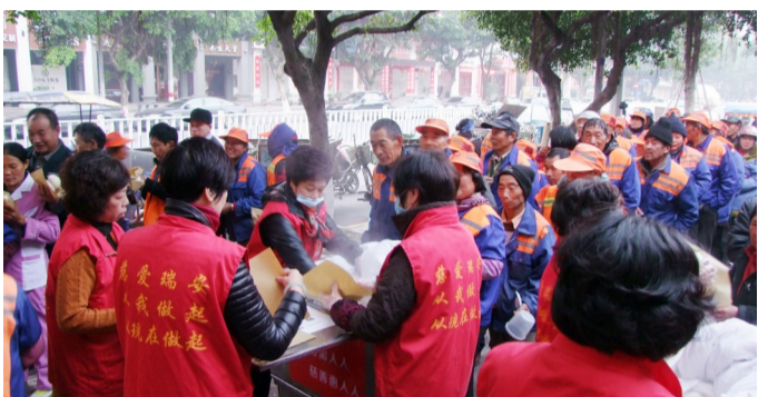
崇德慈善站为环卫工人、流浪者、贫困市民等送去爱心早餐