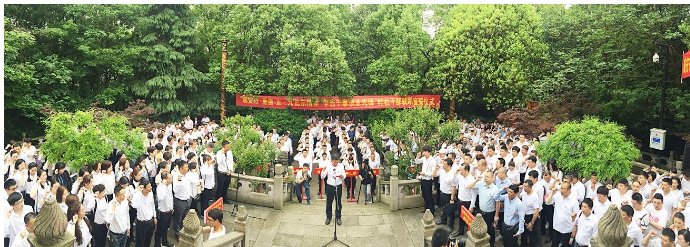
重温“五·九”批示精神 争当干事创业先锋 村社干部就职宣誓仪式

高质高效完成村级组织换届。面对史上时间最紧、要求最严、任务最重的村级组织换届选举工作,采取责任管控、目标管控、人选管控等十个管控办法,切实强化党的领导,严把人选质量关,累计审查候选人 1.3 万名,取消不符合资格人员 491 人,创新村委会选举党员信任票“五步法”,建立村民代表退出机制,村社组织一次性选举成功率大幅提升,群众对新一届两委班子的信任度高达 98.3%,基层政治生态得到了有力净化,村级组织战斗力有效提升。推行村主职干部签订换届竞职、辞职、创业三项承