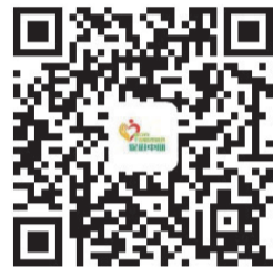
扫一扫关注微信公众号 瑞安市干部心理健康促进中心

目前,团体辅导、一对一心理疏导和心理减压课程,主要面向全市公务员和事业单位在编人员。而在线心理测评和在线解压的功能则不限对象,市民都可以通过公众号使用这些功能。市委组织部相关负责人表示,该平台是我市公务员心理健康促进机制试点工作的重要举措,主要是方便广大干部开展心理健康自测、活动预约,此前我市已在市委党校设立市干部心理健康促进中心。下一步,我市将更好发挥市干部心理健康服务平台作用,尤其是在问题预警、危机处置等方面,为我市干部心理健康提供服务。