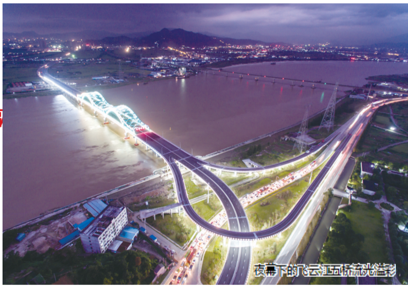
夜下的飞云江流光溢彩

1989年1月6日，飞云江上第一座大桥建成通车，结束了104国道瑞安段飞云江汽车摆渡的历史。此后，飞云江上建起了一座又一座大桥：2002年2月，滨海高速公路飞云江二桥通车；2009年1月，滨海大道瑞安大桥（又称飞云江三桥）通车；2009年9月，温福铁路飞云江四桥通车，这是横跨飞云江的第一座铁路桥；2016年12月15日，飞云江五桥通车。