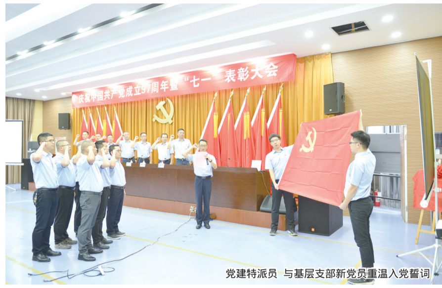
党建特派员与基层支部新党员重温入党誓词

坚持党的领导、加强党的建设是国有企业的根与魂。国家电网公司于2017年启动党建旗帜领航·三年登高计划。在巩固基础建设年工作成果的基础上,今年,国网瑞安市供电公司全面落实对标管理年