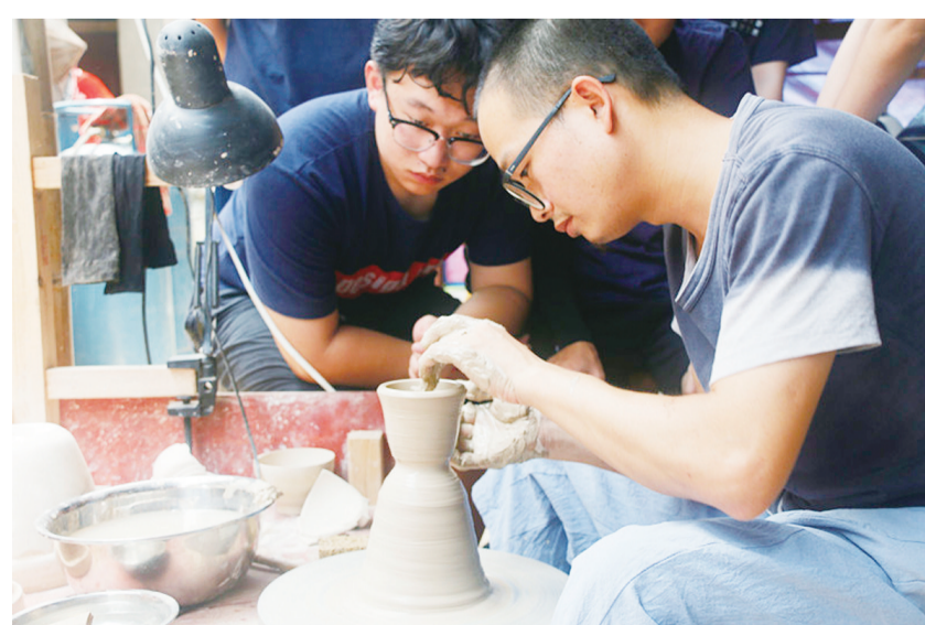
暑期实践队队员学习拉坯

队员纷纷表示,经过两天时间的学习、参观,他们对瓯窑制作的过程有了更深层次的认识,也体会到手艺人传承、发扬传统技艺的匠心。