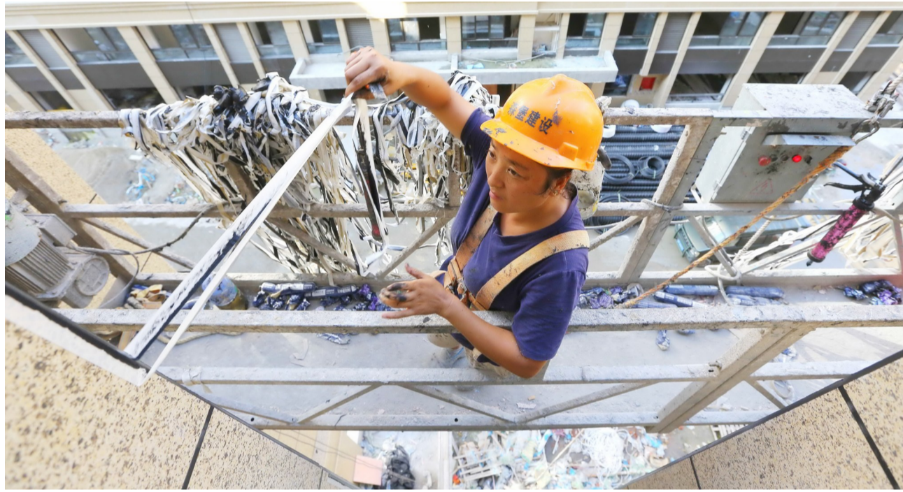
拆整建美 推动城市有机更新

日前,在沿江新村改造工程施工现场,建筑工人们正加快外立面装修。据悉,作为全省单体体量最大的D级危房改造项目,我市以大拆大整促大建大美,从2016年11月启动沿江新村危旧房改造项目拆除工作,2017年启动工程建设,并于2018年2月迎来主体工程结顶。(记者 庄颖昶)